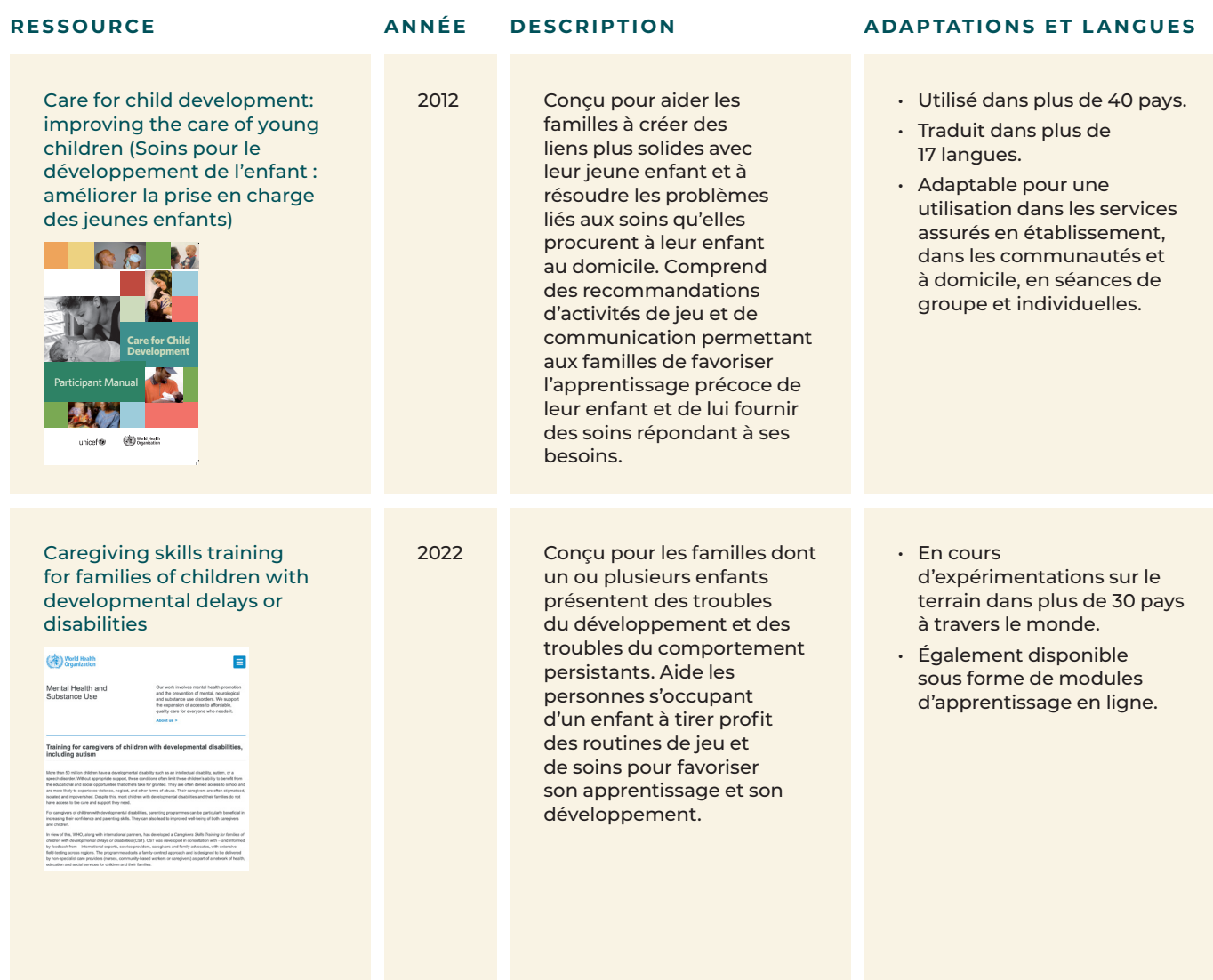
Tableau A2. Programmes de formation pour renforcer les compétences des prestataires de services

De plus amples informations sur ces programmes, vidéos et autres supports de formation supplémentaires sont disponibles sur le site Internet consacré aux soins attentifs ( https://nurturing-care.org ) et sur le site Web du Réseau d'action pour le développement de la petite enfance (ECDAN, https://ecdan.org ). De nouvelles ressources seront ajoutées à mesure qu'elles seront disponibles, ainsi que des exemples sur leur utilisation. Ces sites Internet comprendront également des outils pour évaluer les pratiques de soins, suivre et évaluer les programmes et mesurer le développement de l'enfant, particulièrement appropriés pour les pays à revenu faible et intermédiaire.